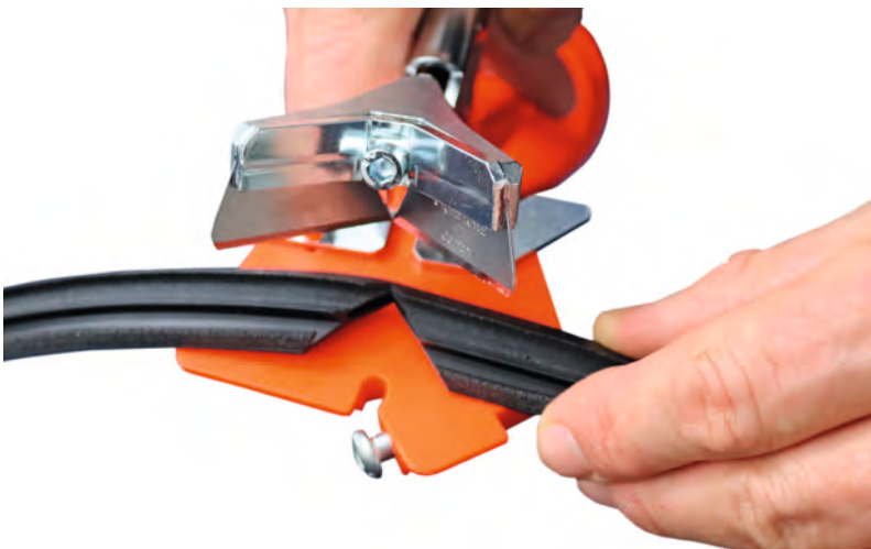
De prestatie van een dichting is afhankelijk van vele factoren. De prestatie van geknipte dichtingen volgens de door de fabrikant verschaft knipinstructies blijft overigens gelijk t.o.v. laskaders.