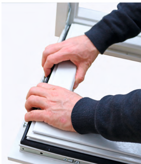
Bij laskadermaatwerk is de dichting gelast in een volledig op maat twee- of vierhoekig kader dat eenvoudig in het kozijn te monteren is.