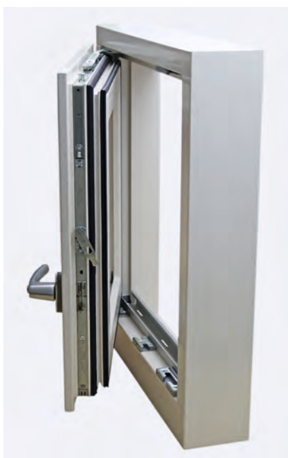
Een laskader is een efficiënte totaaloplossing die de doorlooptijd met kortere levertijden verkort en de verwerker in totaliteit ontzorgt.