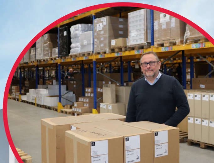
EDDY DE MEYER REYNAERS ALUMINIUM